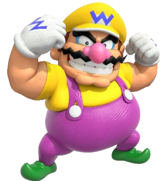
Wario - (Ard)