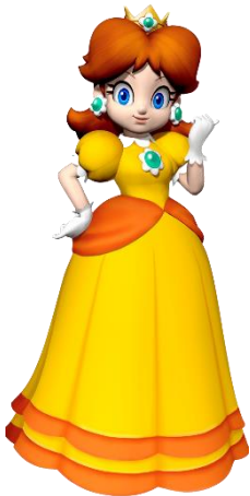
prinses Daisy - (Rosanne)